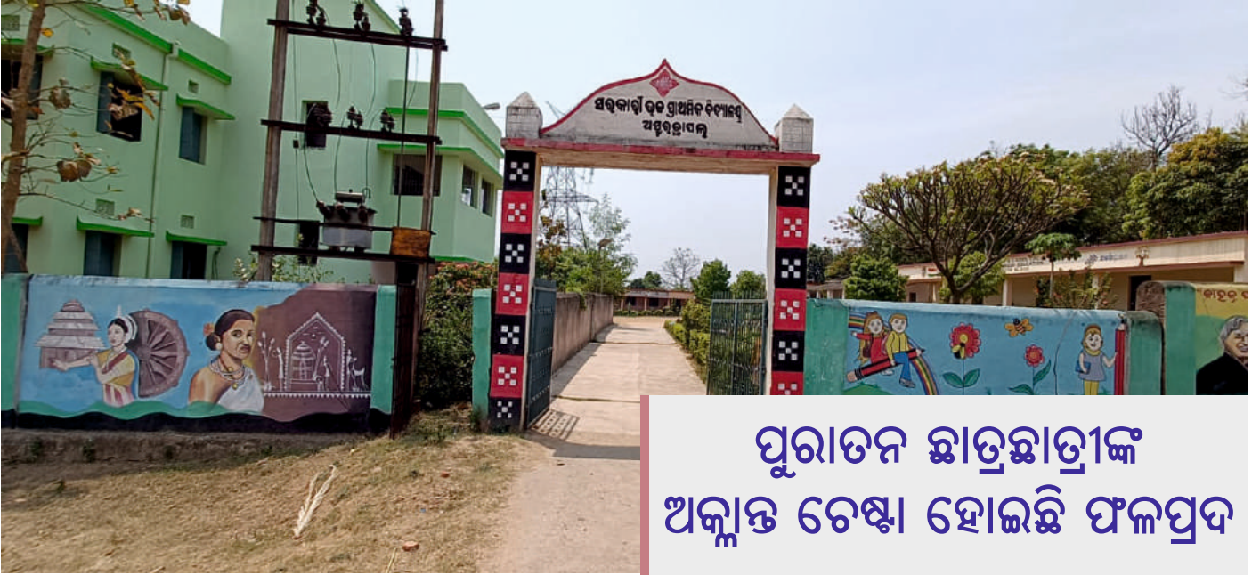
ପୁରାତନ ଛାତ୍ରଛାତ୍ରୀଙ୍କ ଅକ୍ଳାନ୍ତ ଚେଷ୍ଟା ହୋଇଛି ଫଳପ୍ରସ୍ତ

ପିଲାଟି ପାଇଁ ବିଦ୍ୟାଳୟ ହେଉଛି ଦ୍ଵିତୀୟ ଘର । ମାଆର ପଣତ, ବାପାଙ୍କ ସ୍ନେହ, ଗୁରୁଜନଙ୍କ ଆଦର ଭିତରେ ବଢ଼ୁଥିବା ଛୋଟପିଲାଟି ବିଦ୍ୟାଳୟ ପରିବେଶରେ ସେହି ଅନୁଭବ ଖୋଜିଥାଏ । ତେବେ ଏହି ବିକଳ ଘରଟିକୁ ପିଲାମାନଙ୍କ ପାଇଁ ଆକର୍ଷଣୀୟ କରିବା ଉଦ୍ଦେଶ୍ୟରେ ନବୀକରଣ ହୋଇଛି ଅସୁରଛାପଲ ସରକାରୀ ଉଚ୍ଚ ପ୍ରାଥମିକ ବିଦ୍ୟାଳୟ । ଏହା ସଫଳ ହୋଇପାରିଛି ପୁରାତନ ଛାତ୍ରଛାତ୍ରୀଙ୍କ ଅକ୍ଳାନ୍ତ ଚେଷ୍ଟା ଓ ପରିଶ୍ରମ ପାଇଁ । ଏହାର ସୌନ୍ଦର୍ଯ୍ୟ, ଶୈକ୍ଷିକ ବାତାବରଣ ସାଙ୍ଗକୁ ପାଠପଢ଼ାର ଶୈଳୀ ପିଲାମାନଙ୍କୁ ଆକୃଷ୍ଟ କରୁଛି ।