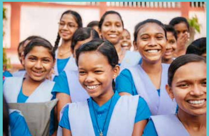
‘ମୋ ସ୍କୁଲ ଅଭିଯାନ’- କେତୋଟି ପାଇଲ୍ ଚିତ୍ର