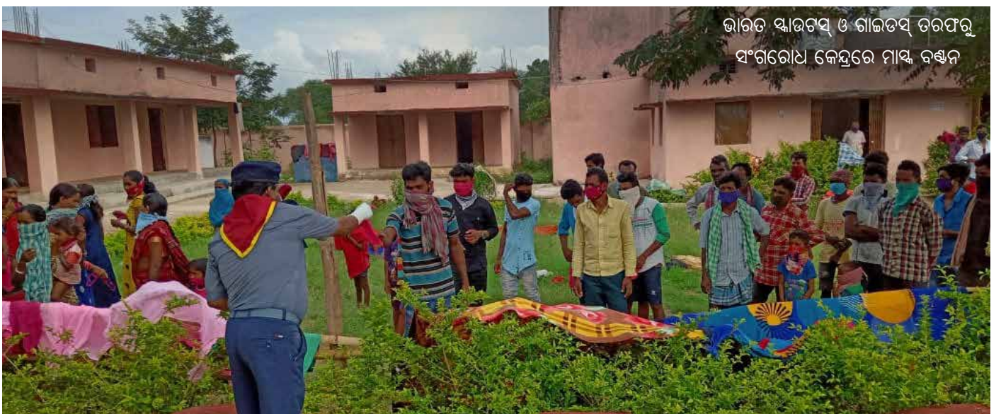
ଭାରତ ସ୍ୱାତନ୍ତ୍ର୍ୟ ଓ ଗାନ୍ଧିଜୀଙ୍କ ଚରଫରୁ ସଂଗରୋଧ କେନ୍ଦ୍ରରେ ମାୟା ବଣ୍ଟନ

ଲକ୍ତାଉନ୍ ସମୟରେ ମୋବାଇଲ୍ ଫୋନ୍ ଏବଂ ଅନ୍‌ଲାଇନ୍ ମାଧ୍ୟମକୁ ଆଧାରକରି ପାଠପଢ଼ା ଜାରି ରଖିବା ଫଳରେ ସବୁ ମହଲରୁ ପ୍ରଶଂସା ପାଇପାରିଛି ଏହି ସ୍କୁଲ ।