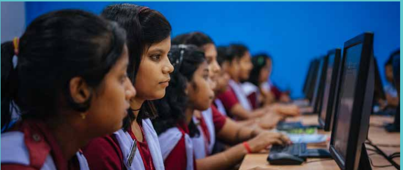
‘ମୋ ସ୍କୁଲ ଅଭିଯାନ’- ଏମାନେ ଆମର ଭବିଷ୍ୟତ

‘ମୋ ସ୍କୁଲ ଅଭିଯାନ’ ମାଧ୍ୟମରେ କେସିଙ୍ଗା ସରକାରୀ ଉଚ୍ଚବିଦ୍ୟାଳୟ ଯେଭଳି ଅନୁକୂଳ ପରିବେଶ ସୃଷ୍ଟି କରିପାରିଛି, ତାହା ବାସ୍ତବିକ ପ୍ରଶଂସାଯୋଗ୍ୟ । ଏହି ଗଠନମୂଳକ ବାତାବରଣ ଅଭିଭାବକ, ପୁରାତନ ଛାତ୍ରଛାତ୍ରୀ ଏବଂ ଶିକ୍ଷକଶିକ୍ଷୟିତ୍ରୀଙ୍କ ମଧ୍ୟରେ ଆନନ୍ଦର ଲହରୀ ଖେଳାଇପାରିଛି ।