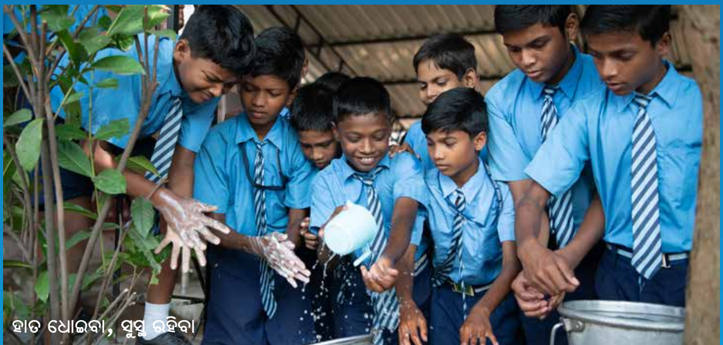
ହାତ ଧୋଇବା, ସୁସ୍ଥ ରହିବା